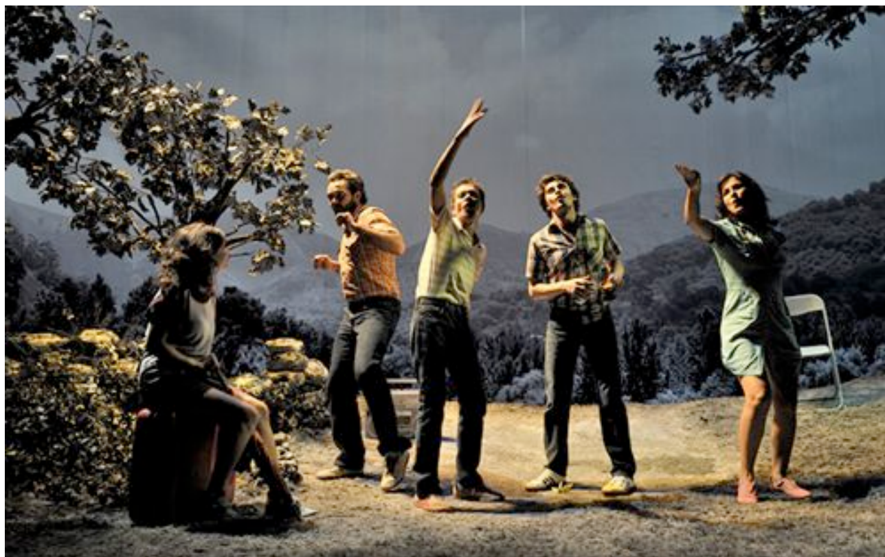
(Fotografías del espacio escénico)