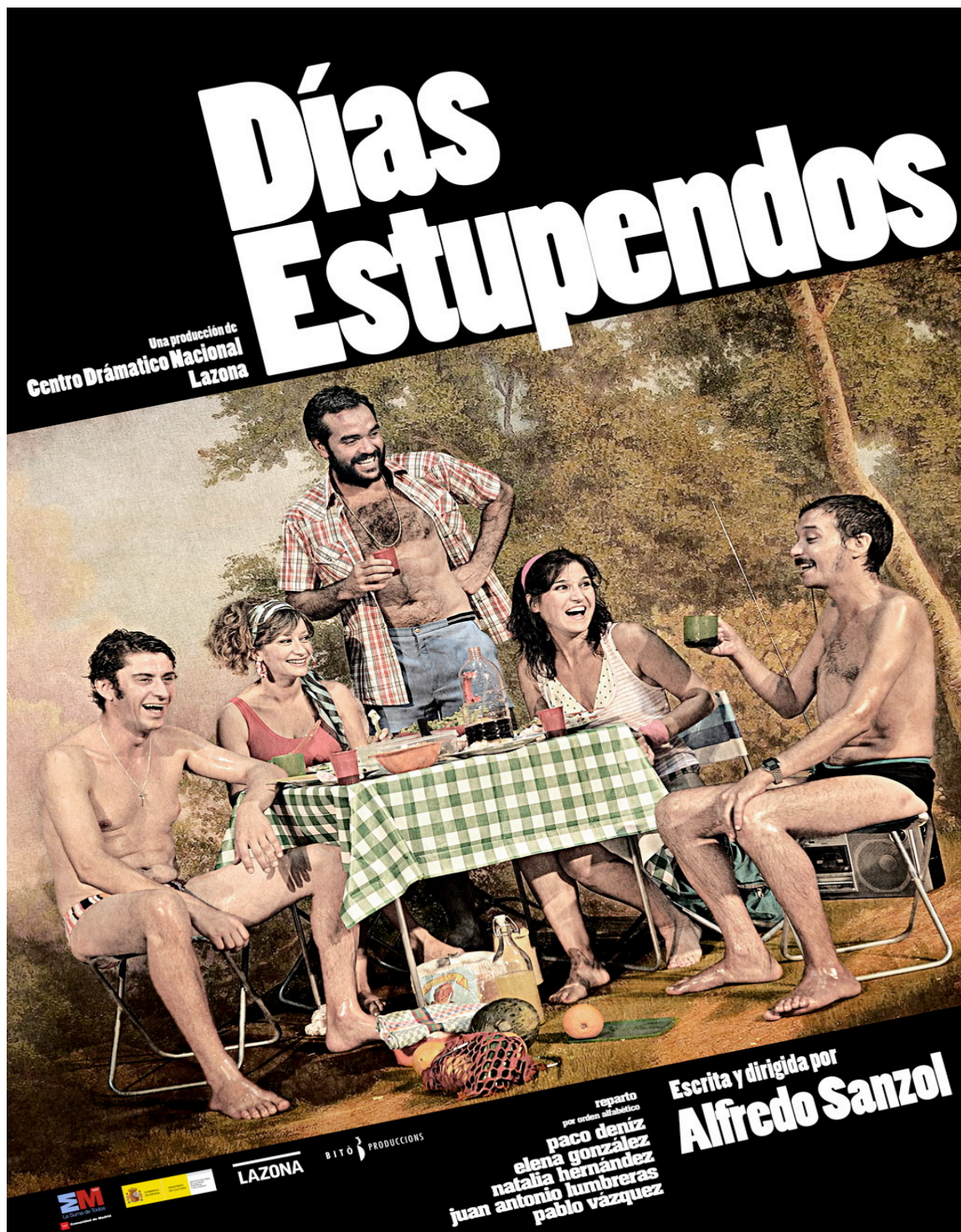
(Cartel de la obra)