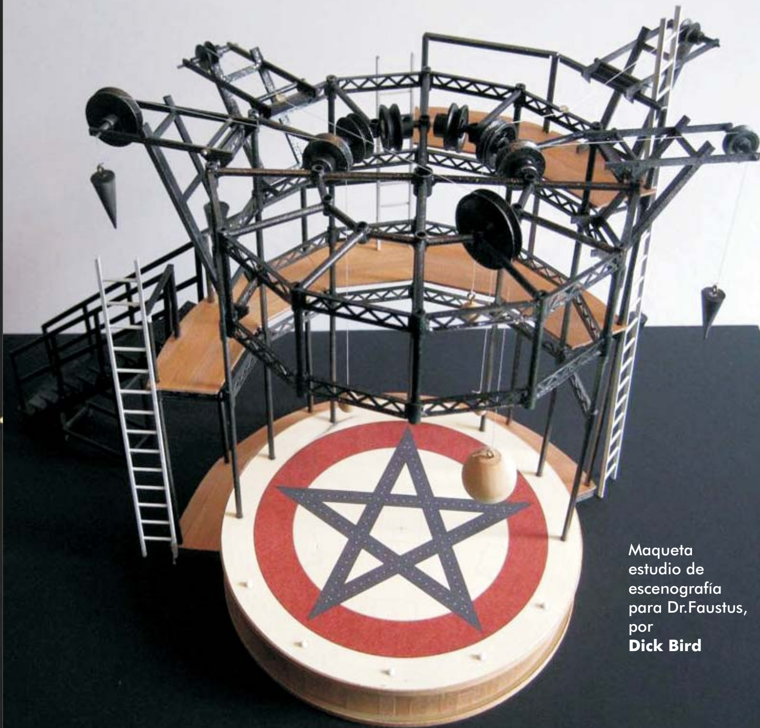
Maqueta estudio de escenografía para Dr.Faustus, por Dick Bird