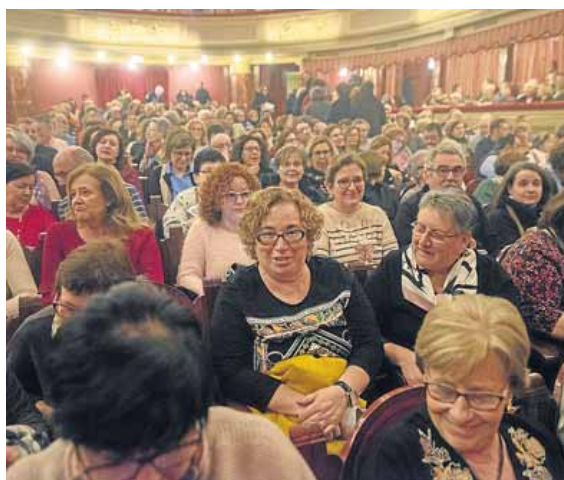
Público asistente al estreno de ayer. MARÍA FUENTES

hasta las trancas en levantar este ejemplo de cómo en tiempos de desmemoria, falsas verdades y cinismo explícito, el teatro puede ser útil para cambiar la realidad cuando en ella pasan hechos que claman al cielo. Pero no es a las alturas inciertas a quién se clama aquí sino a la que tenemos delante. Teatro político, militante, necesario que también emociona, divierte, golpea con la palabra o la música desde una interpretación desnuda y valiente como el gesto final de Belda. La larga ovación final fue para las tres actrices y Forqué por su faena. Las máscaras al servicio de una necesidad ética siguen funcionando a la perfección como en los días de aquella convulsa transición en la que también estaban ellas.