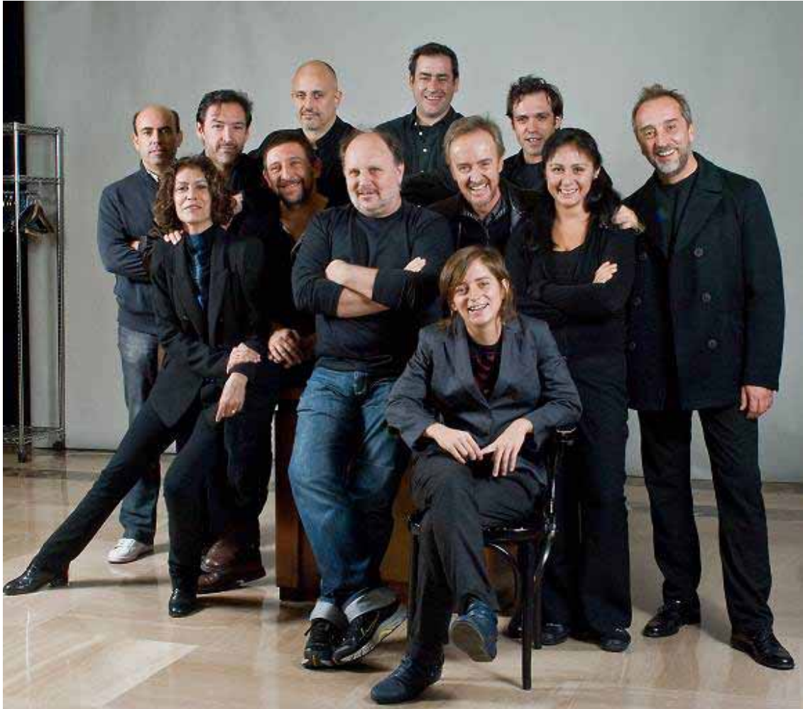
Equipo artístico de Glengarry Glen Ross